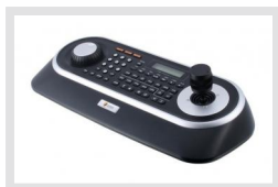
KBD-2USB | Réf.: 217652