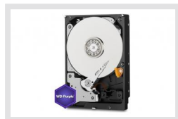
HDD-4000SATA Purple | Réf.: 217659