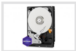
HDD-2000SATA Purple | Réf.: 217658