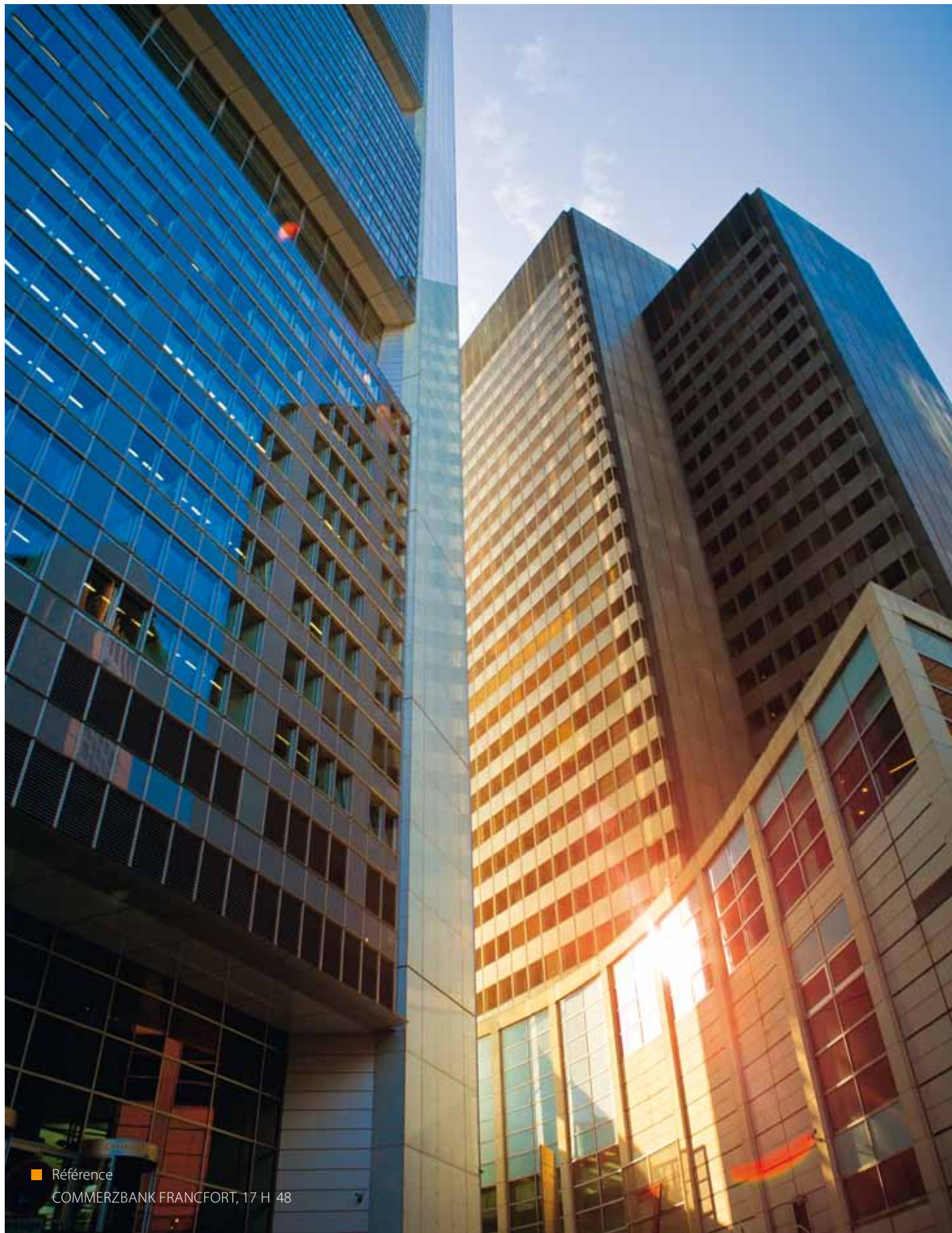
■ Référence COMMERZBANK FRANCFORT, 17 H 48