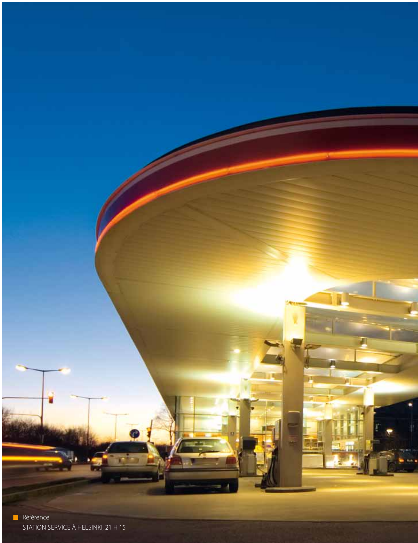
■ Référence STATION SERVICE À HELSINKI, 21 H 15