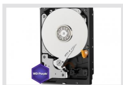
HDD-6000SATA Purple | Réf.: 217660