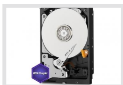
HDD-3000SATA Purple | Réf.: 217657