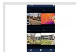
eneo Center mobile | Réf.: 217850