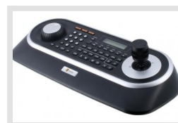
KBD-2USB | Réf.: 217652