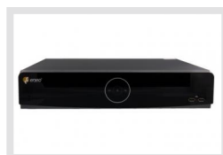
IEM-38R640005A | Réf.: 217651