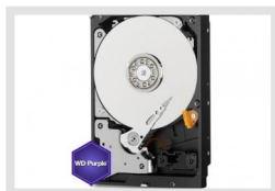
HDD-6000SATA Purple | Réf.: 217660